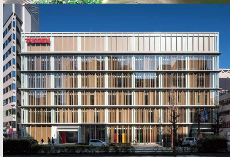
タキゲン製造本社ビル