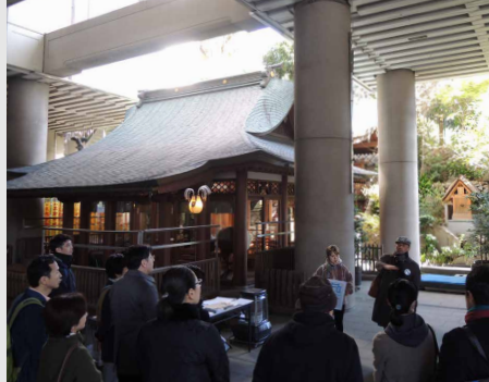
過去のガイドツアーの様子(雉子神社)