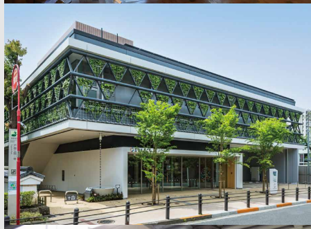
品川区立環境学習交流施設「エコルとごし」