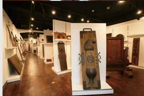
昭和ネオン高村看板ミュージアム