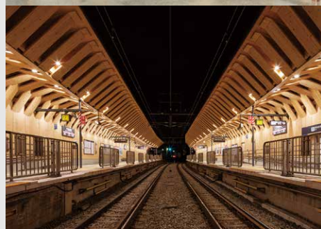
東急池上線戸越銀座駅