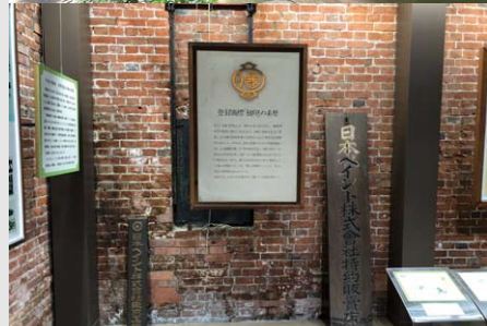
日本ペイントホールディングス(株) 明治記念館