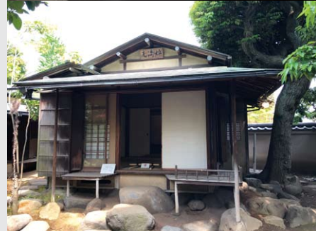
品川歴史館 茶室「松滴庵」