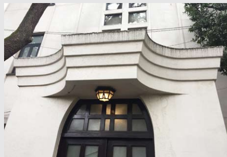
日本音楽高等学校1号館(旧池田菊苗邸)