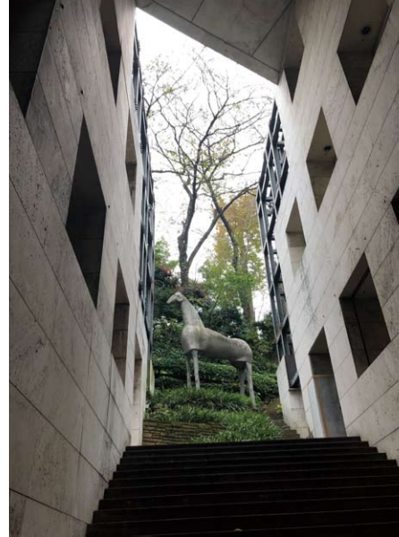
東京デザインセンター

※「オープンしなけん」は普段は一般公開されていない建築物等を所有者・関係者のご厚意により特別に公開していただくことで成立するものです。マナーを守ってお楽しみいただきますよう、ご協力をお願い申し上げます。